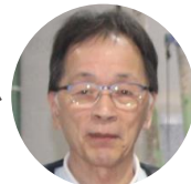
和藤1号先生 わとう

2月からスタッフが増えます 振り替えしないお友達は前からいる先生も知らないかとも思い全員紹介します 覚えて下さいね! 先生からお願いします 胸に名前の無いお友達は至急付けて下さい 新しい先生も頑張ってください。